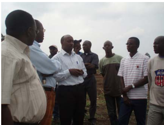
En visite au chantier Kibagabaga

La seule qui revenait de la plupart des bouches concernait l'organisation de ladite rencontre. Effectivement, l'on a recommandé de l'organiser mieux et efficacement comme dans d'autres provinces. Une autre suggestion accordée par tous concernait le classement et la mise en archive des rapports des réunions du genre. Car nous nous sommes rendus compte de la pertinence de l'évaluation de la mise en application des résolutions et perspec-