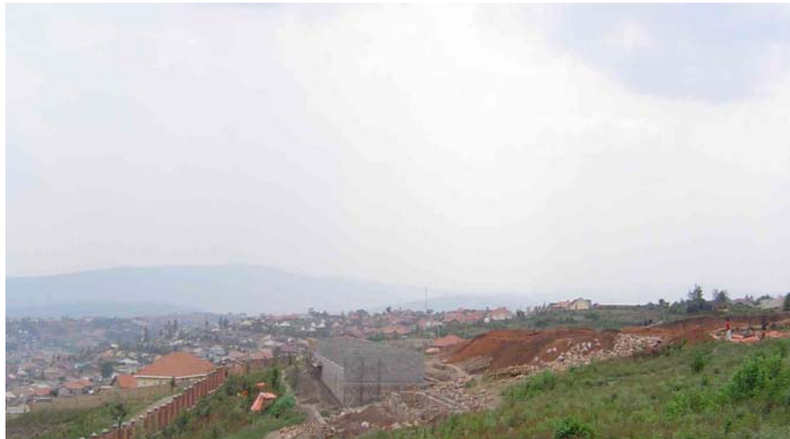
Le Chantier de Kibagabaga

A gauche de la photo se trouve le pavillon de dix classes : les terrassements sont achevés, les fondations sont solidement maçonnées ; les murs ont été élevés jusqu'au linteau ; les ouvriers ont commencé les coffrages du linteau.