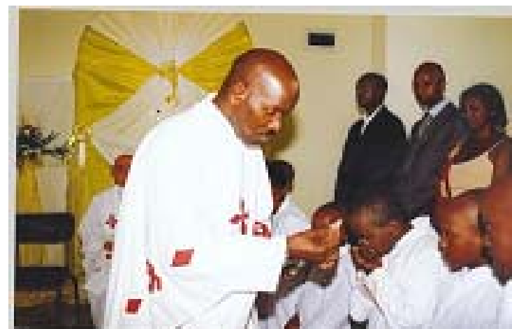
Ecole primaire Saint Ignace Le 1er novembre 2008, un groupe d'enfants A reçu la Première Communion.

Région Jésuite Rwanda-Burundi, B. P. 6039 Kigali-Rwanda Tél: 00 250 55102966 — Email: sjkigali@rwanda1.com Site web : http://www.abayezuwiti.com