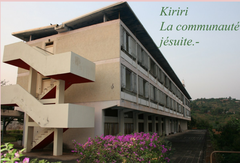
Kiriri La communauté jésuite.-